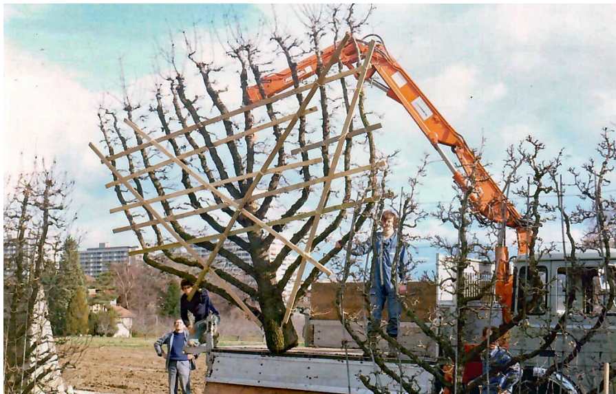
Fevrier 1975 transfert à Lullier