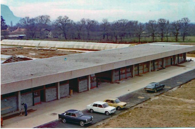
Ateliers Nord 02.1975