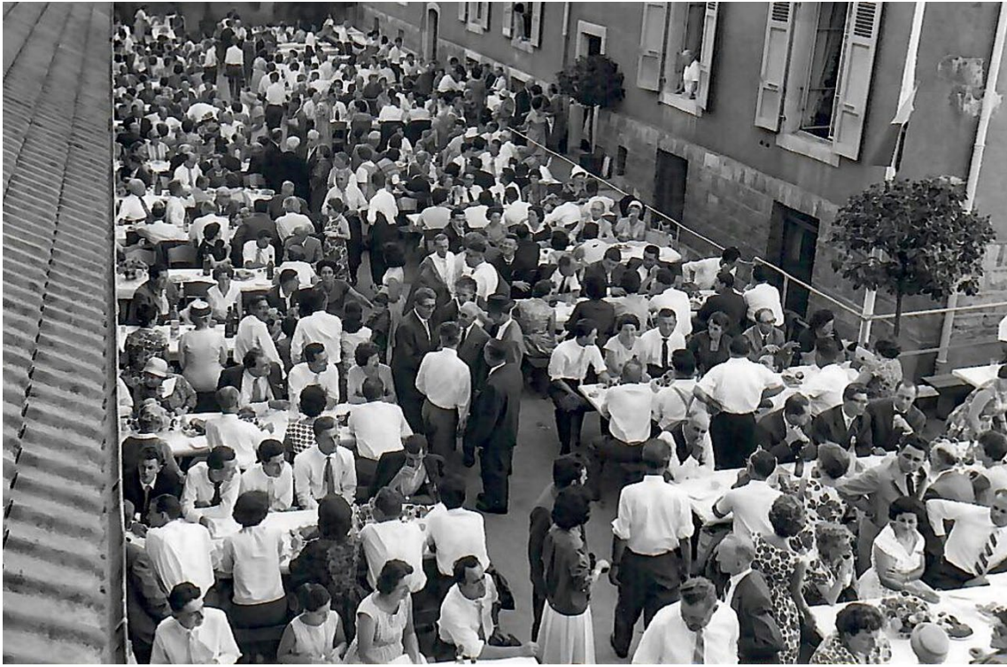
75ème Chatelaine - Grande collation à Chatelaine