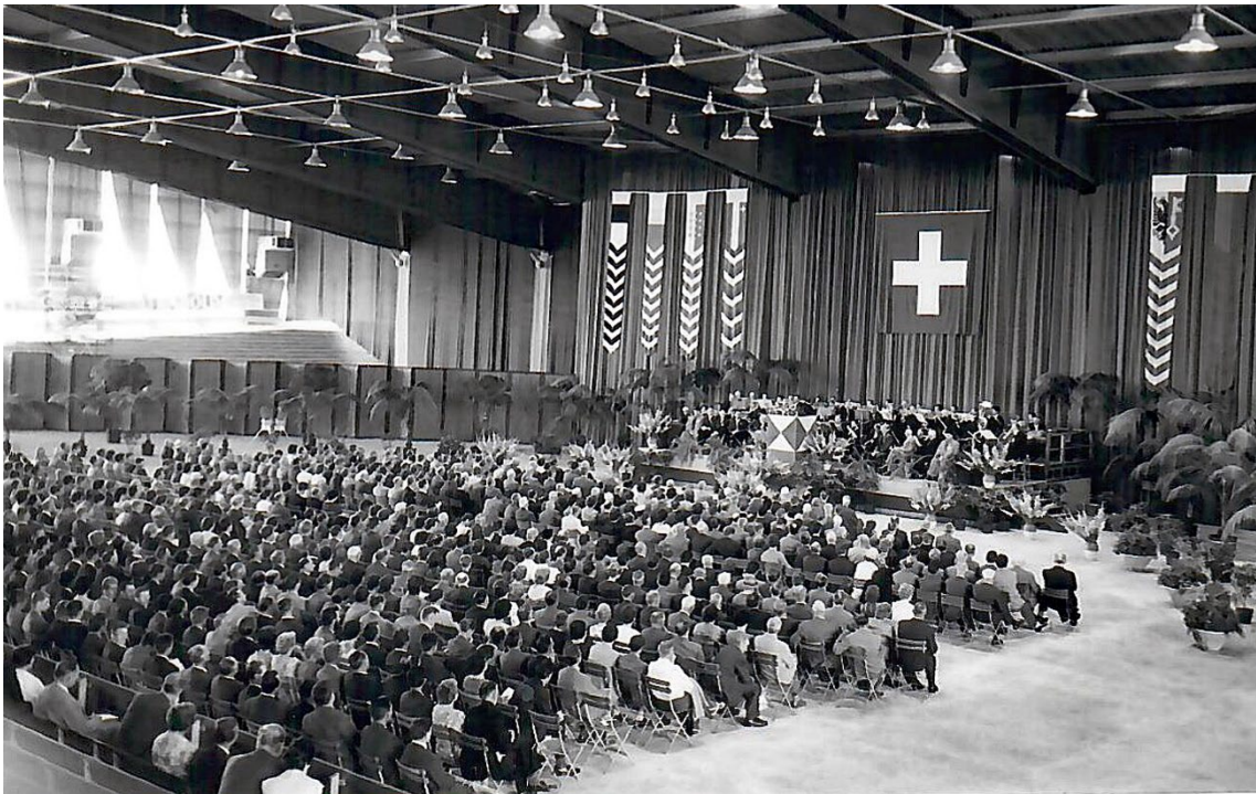
75ème Chatelaine - patinoire Vernets 17.09.1961