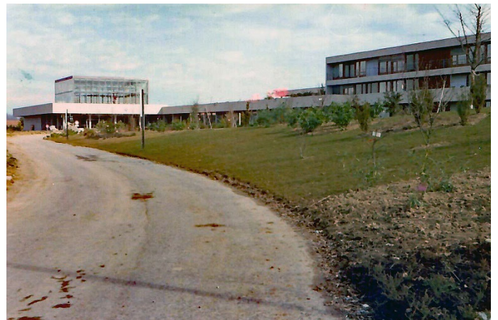
Internat-jardin hiver 02.1975