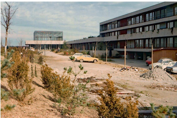
Internat Ouest 02.1975