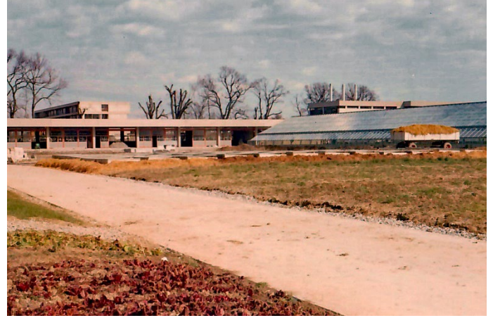
CM et ateliers 1975