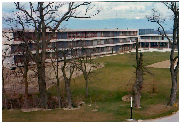
Internat Est 1975